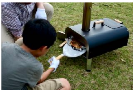
みんなのところが一つになった食のワークショップでの「ピザづくり」。自分でユーグレナを入れた生地を捏ね、トッピングを考え、自分でピザ釜を使って焼き上げました。とてもきれいな緑色の美味しいピザができました。